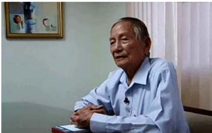
謝英鐸博士近照

我駐多明尼加技術團謝英鐸前團長長年在多國進行水稻改良工作，貢獻良多，很得該國人民景仰，都稱呼為謝博士，有多明尼加水稻之父的美名。