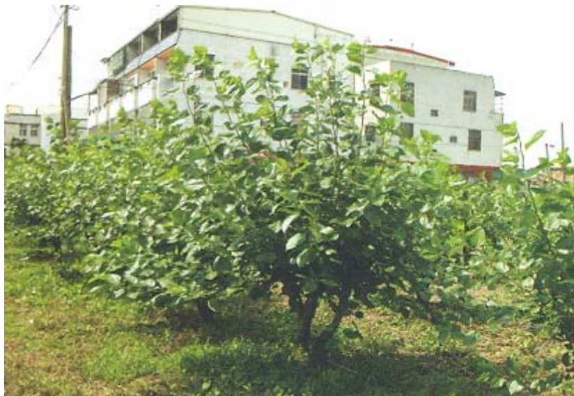
桑椹品種‘苗栗 1 號’於 2 月初開花，此為雌株