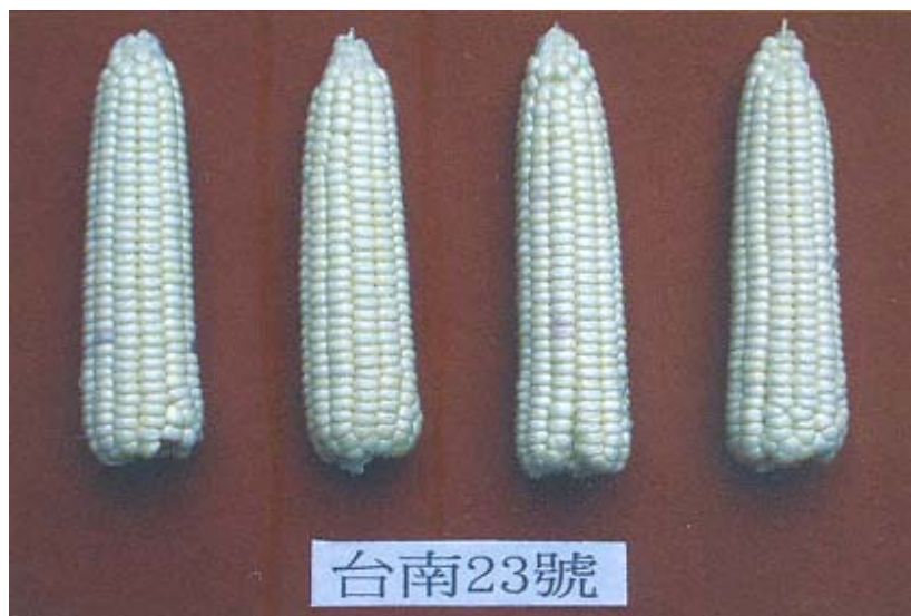
糯玉米品種‘台南 23 號’口感風味俱佳

因‘台南 23 號’需要較多水分，可當作蔬菜栽培，並可全年栽種。糯玉米在東南亞試作後，一致獲得好評，且不同於一般市面上玉米，具糯性，皮薄內 Q，有較好的口感。不久後，還有一新玉米品種‘台南 24 號’即將推出，請拭目以待。