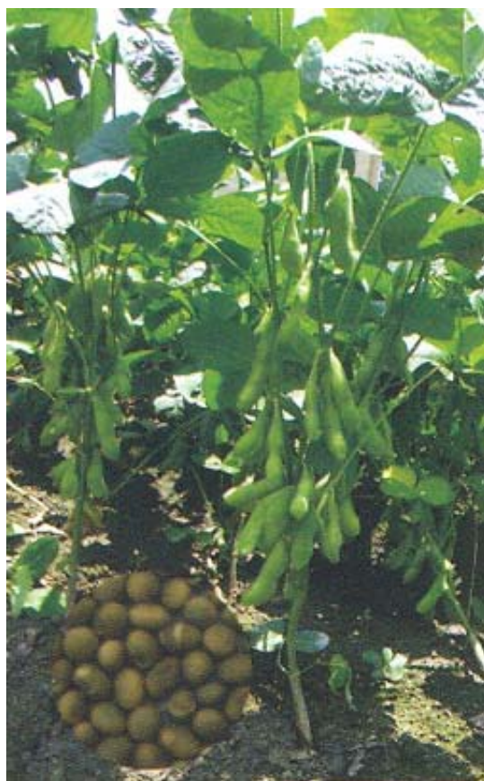
毛豆品種‘高雄 10 號’ (綠香) 品種之全株及種子