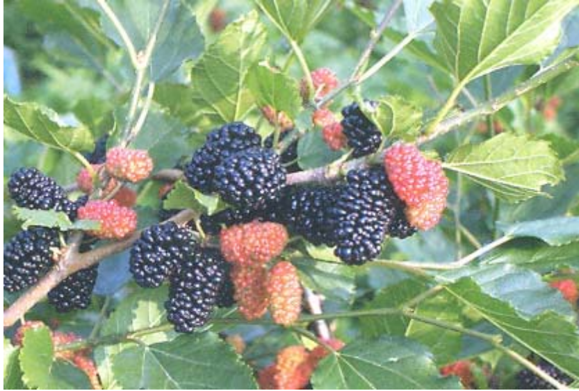
桑椹品種‘苗栗 1 號’結實累累，產量高